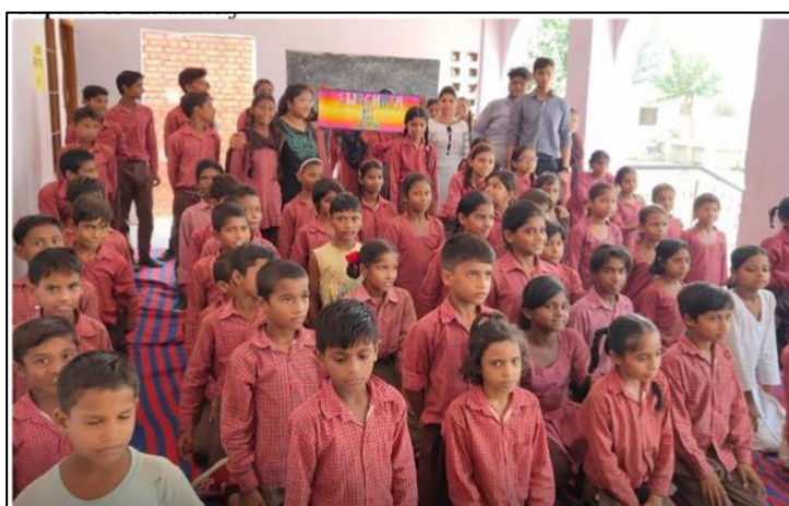
Awareness program 'Swachhta Hi Seva' (against Single-use Plastic) Awareness Campaign in adopted villages by UBA Cell on 9 th Sept, 2019

In addition to this, Environment promotional campaigns and plantation drives are organized by Vasundhara ECO-CLUB, UBA Cell, NSS Cell of the university to sensitize the students, staff and society people.