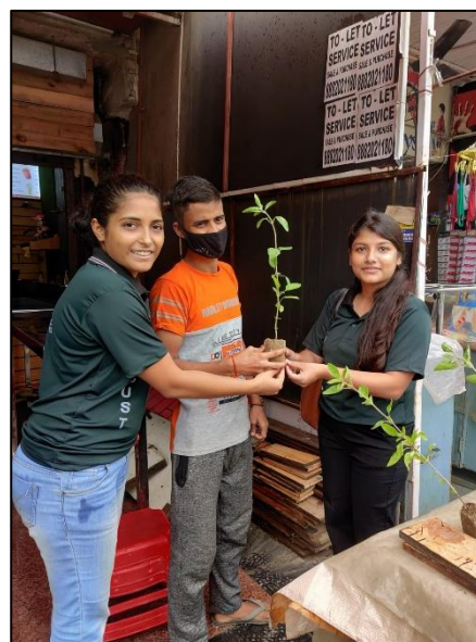
Tulsi Plant Distribution Program by Vasundhara ECO-CLUB on 16 th September, 2021. More than 1000 Tulsi plant saplings were distributed to students, staff and society people