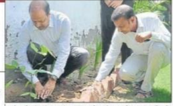
वाईएमसीए में शनिवार को 'एडॉप्ट ए ट्री' अभियान की शुरुआत की गई।

इंस्टाग्राम @ymcaenvironmentalsociety टूटिटर @ymcaenvironment1 फेसबुक https://bit.ly/2LFgKxb