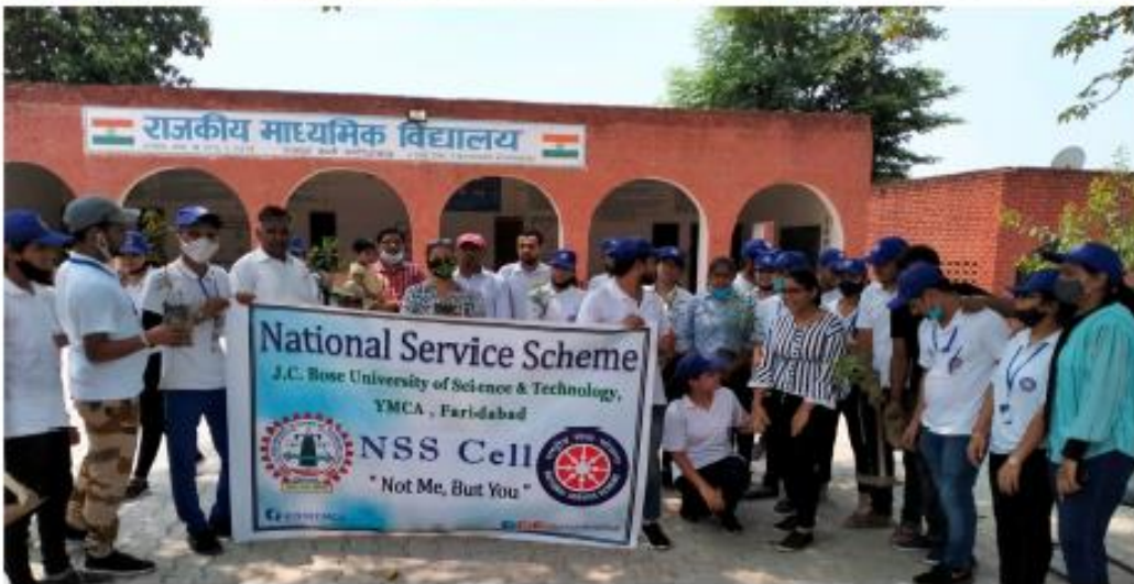
Tree Plantation Drive in University Adopted Villages by NSS Cell on 17 th July & 18 th July