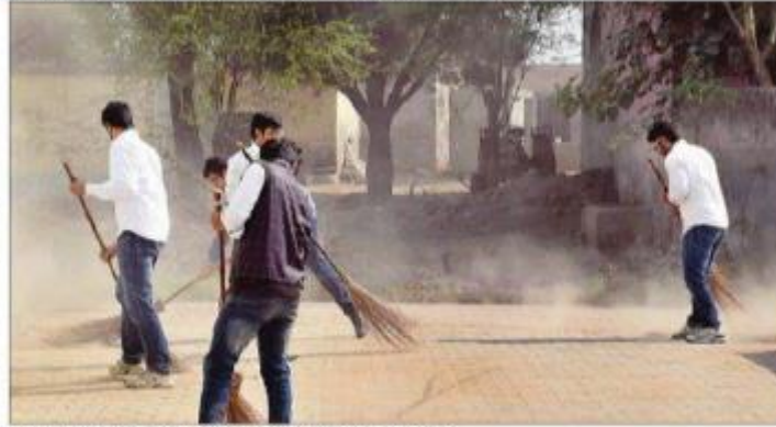
सफाई अभियान चलते आईएमसीए यूनिवर्सिटी के छात्र।