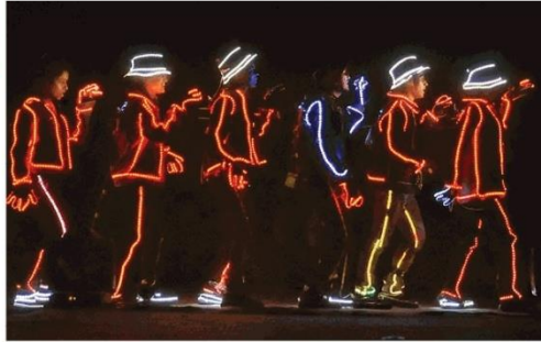
वार्डमसीए यूनिवर्सिटी में चल रहे तुमोस्टेंजा इवेंट में विद्यार्थियों ने एलईडी कॉस्ट्यूम फनकर प्रस्तुत किया।

जगरण संवाददाता, फरीदाबाद : वार्डमसीए विश्वविद्यालय में चल रहे वार्षिक सांस्कृतिक एवं तकनीकी उत्सव एलीमेंट्स कलमायका-2018 के तीसरे दिन के प्रमुख आकर्षण में से एक विविधा क्लब द्वारा आयोजित नुक्कड़ नाटक प्रतियोगिता रही, जिसमें फरीदाबाद व एसीए के विभिन्न कालेज व थिएटर क्लब के विद्यार्थियों ने हिस्सा लिया। विश्वविद्यालय की 21 सदस्यीय टीम द्वारा राजनीति और अपराध को लेकर नाटक मंचन किया और राजनीति को अपराध मुक्त बनाने के लिए लोगों को जागरूक किया गया। विविधा क्लब द्वारा प्रस्तुत माइम को भी काफी सराहना मिली। इसके अलावा, तीसरे दिन के अन्य इवेंट्स में 'दरगाज क्लब का ड्रास यूआर हार्ट आउट', 'बाल्युम क्लब का ड्रम शोर्ट', 'एकलव्य क्लब का कॉक फाइटर', अनन्य क्लब का काव्योत्सव, युजन क्लब को कलाकृति प्रतियोगिताएं प्रमुख रही। इसके अलावा, दिनभर चले इवेंट्स में विद्यार्थियों ने जमकर मस्ती की।