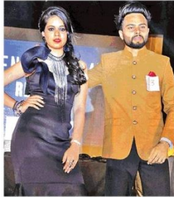
फैशन शो के दौरान रैप पर बॉक करते हुए विद्यार्थी।