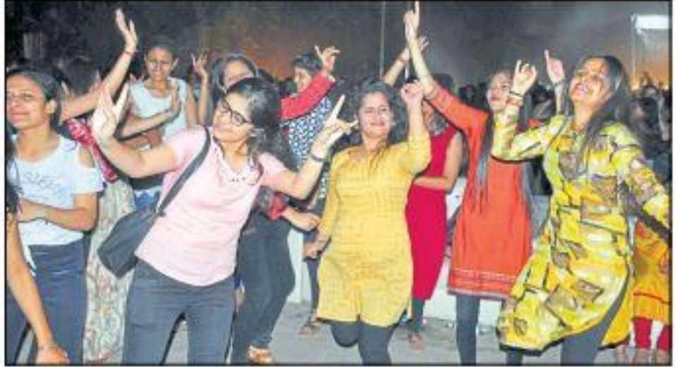
वाईएमसीए यूनिवर्सिटी में कलमायका उत्सव के दौरान शुक्रवार को डीजे नाइट में छात्रों ने जमकर मस्ती की। • सुभाष शर्मा

इसे मौजूद विद्यार्थी और छात्रों ने इसे खूब सराहा। आयोजकों के अनुसार विजेताओं की घोषणा देर रात की जाएगी। वहीं, भागड़ा क्लब की ओर से भांगड़ा प्रस्तुत किया गया। इसके साथ ही परिसर में सुबह से ही जुंचा जारी रहा। अंतिम दिन भी प्रश्नोत्तरी, नृत्य व अभिनय, काव्य, वाद-विवाद, चित्रकारी, कला एवं शिल्प, फोटोग्राफी तकनीकी एवं कंप्यूटर आधारित प्रतियोगिताएं जारी रहीं।