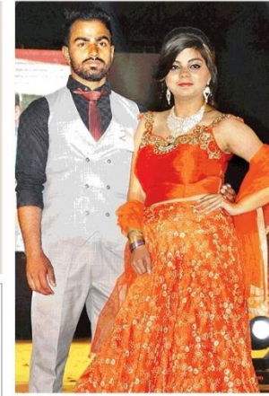
एलीमेंट्स कलमायका के दौरान आयोजित फैशन शो में रैप पर बॉक करते हुए विद्यार्थी।