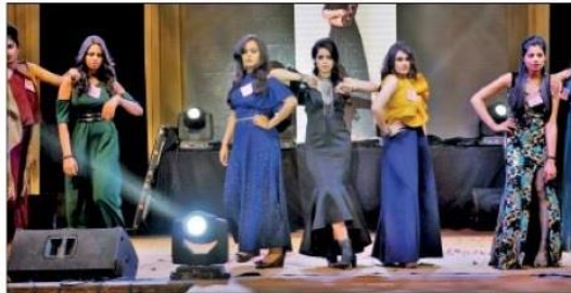
शनिवार को फैशन शो का आयोजन किया गया