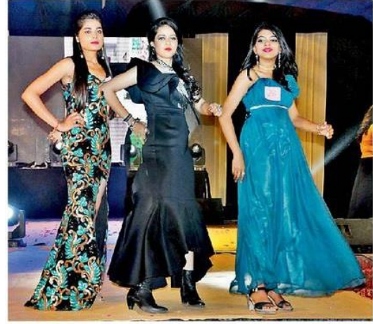
भास्कर न्यूज | फरीदाबाद

वार्डमसीए विश्वविद्यालय के वार्षिक सांस्कृतिक एवं तकनीकी उत्सव 'एलीमेंट्स कलमायका-2018' में भारतीय संस्कृति की झलक को दर्शाता 'रंगरीति' सब के आकर्षण का केंद्र रहा। संगीत की धुन पर रैप पर बॉक करते विद्यार्थियों ने न सिर्फ भारतीय पारम्परिक वेशभूषा को खूबसूरत ढंग से प्रदर्शित किया। बल्कि प्रोफेशनल मॉडल की तरह नजर आए। इस शो में विद्यार्थियों द्वारा पहने गए परिधान विशेष रूप से डिजाइन किए गए थे। सभी ने शो और परिधानों को काफी पसंद किया।