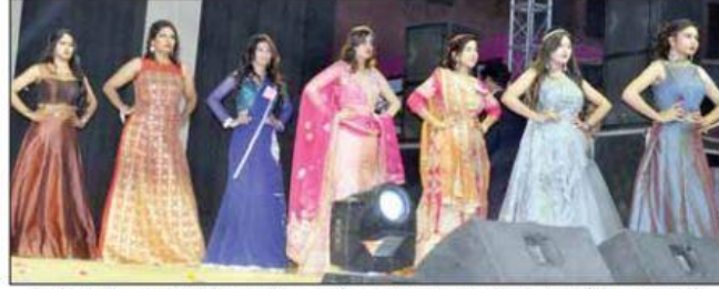
वाईएमसीए विज्ञान एवं प्रौद्योगिकी विश्वविद्यालय फरीदाबाद के वार्षिक सांस्कृतिक एवं तकनीकी उत्सव एलीमेंट्स कलमायका 2018 में फैशन शो में रैप पर बैटवॉक करती छात्राएं।