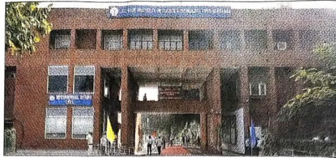
The new campus of JC Bose University has been proposed near Bhakri on the Faridabad-Gurugram road.