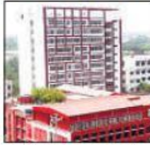
नए विज्ञान खण्ड का चित्र।