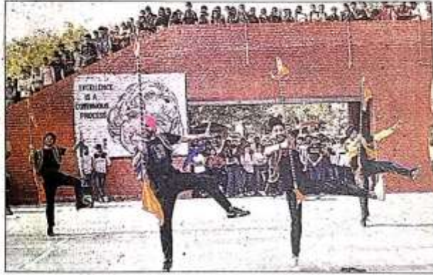
जेसीबोस वाईएमसीए में वैसाखी पर्व के अवसर पर नृत्य करते छात्र।