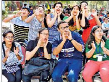
मंच पर प्रस्तुति के दौरान बीवर करते विद्यार्थी।