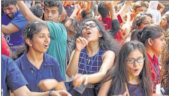
फरीदाबाद स्थित वाईएमसीए यूनिवर्सिटी में शनिवार को कलमायका फेस्ट के दूसरे दिन डॉस के दौरान छात्रों द्वारा। • सुभाष शर्मा

जिसमें फरीदाबाद के करीब सात कालेज और तीन स्कूलों के छात्रों ने भी हिस्सा लिया। इसके अलावा, सांस्कृतिक मंच पर मिस्टर डेड मिस कलमायका व माध्यम जैसे कार्यक्रमों की धूम रही। माइक्रोवर्ड क्लब द्वारा