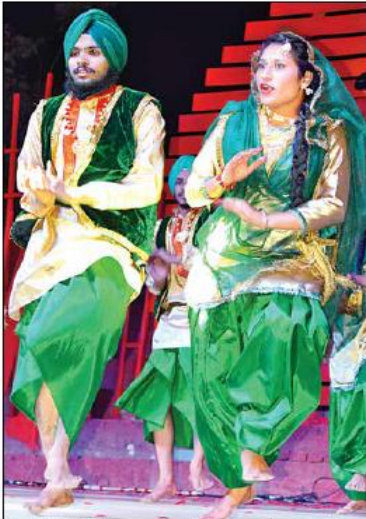
वाईएमसीए युनिवर्सिटी में कलमायका उत्सव के दौरान मुख्य स्टेज पर आमंडल की प्रस्तुति में सभी का मन मोह लिया।