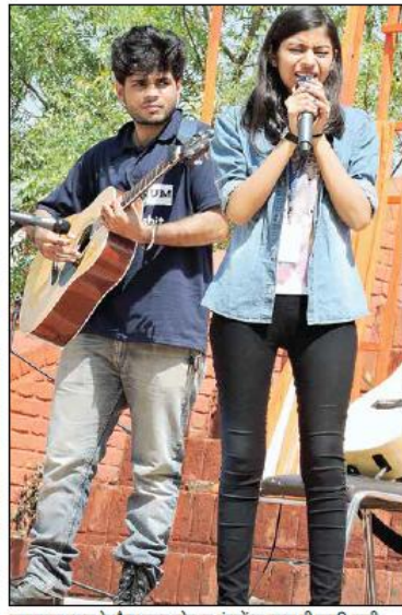
कलमायका उत्सव के दौरान मुख्य स्टेज पर इंस्ट्रुमेंटल गायन की प्रस्तुति करती छात्रा।

कलमायका उत्सव के अलावा उत्सव के दौरान मुख्य स्टेज पर स्मृद्ध नृत्य की प्रस्तुति देते विद्यार्थी।