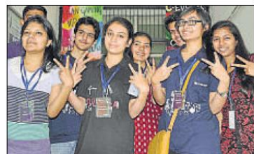
मनन क्लब की छात्राओं ने फेस्ट में अपना योगदान देने के बाद खुशी जताई।