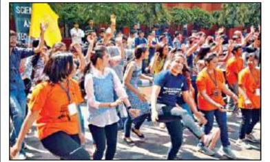
उत्सव के दौरान फनी नॉब में हिस्सा लेती छात्राएं।