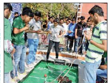
रोबोट के बीच होरी प्रतियोगिता प्रतियोगिता।

कलमायका उत्सव के दौरान मुख्य स्टेज पर स्मृद्ध नृत्य की प्रस्तुति देते विद्यार्थी।