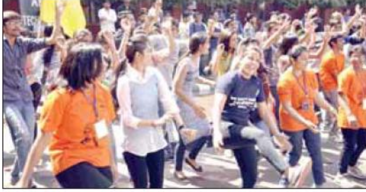
वाईएमसीए यूनिवर्सिटी में आयोजित कलमायका कार्यक्रम के दौरान डांस करती छात्राएं।

फरीदाबाद, (नवीन धमीजा, ब्यूरोचीफ): वाईएमसीए विज्ञान एवं प्रौद्योगिकी विश्वविद्यालय का वार्षिकोत्सव एलीमेंट्स कलमायका-2016 के दूसरे दिन विभिन्न मनोरंजक खेल प्रतियोगिताओं, प्रश्नोत्तरी, एकल गायन तथा वाद-विवाद प्रतियोगिताओं का आयोजन किया गया। दूसरे दिन के इवेंट्स में हथलॉन, रोबो सोकर, लेन गेमिंग, ब्रेन बस्टर, विंक विद द इंक, पेंट, रोड, घनचक्कर, विट्सविला जैसे इवेंट प्रमुख रहे। इसके अलावा सांस्कृतिक मंच पर मिस्टर एंड मिस कलमायका व माइम जैसे कार्यक्रमों का आयोजन किया गया। दूसरे दिन