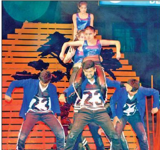
कलमायका उत्सव के दौरान मुख्य स्टेज पर स्मृद्ध नृत्य की प्रस्तुति देते विद्यार्थी।