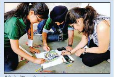
कलमायका उत्सव के दौरान रस्वकेश्वरी कपटी छात्राएं।

कलमायका उत्सव के दौरान मुख्य स्टेज पर स्मृद्ध नृत्य की प्रस्तुति देते विद्यार्थी।