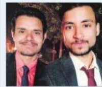
Members of the start-up team of the JC Bose University of Science and Technology, YMCA.

Named as 'Kavach', YMCA's start-up Cyndi Tech developed it as a part of the Centre's Covid-19 Solution Challenge under