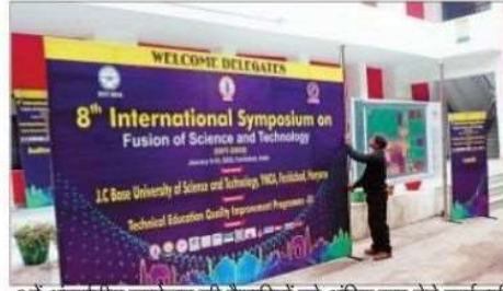
8वें अंतर्राष्ट्रीय सम्मेलन की तैयारियों को अंतिम रूप देते कर्मचारी।

फरीदाबाद, 6 जनवरी (पूजा शर्मा): जे.सी. बोस विज्ञान एवं प्रौद्योगिकी विश्वविद्यालय, वाईएमसीए फरीदाबाद द्वारा फ्यूजन आफ साईंस एंड टेक्नोलॉजी पर आयोजित किये जा रहे 8वें अंतर्राष्ट्रीय सम्मेलन (आईएसएफटी-2020) को लेकर सभी तैयारियां पूरी कर ली गई हैं। सत्र के पहले दिन विदेशों से पहुंच रहे प्रतिनिधियों का पंजीकरण किया गया और यह प्रक्रिया देर सायं तक