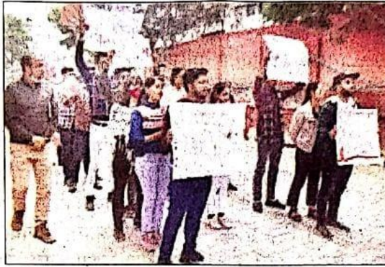
एड्स जागरूकता रैली में हिस्सा लेते हुए विश्वविद्यालय के विद्यार्थी एवं शिक्षक।