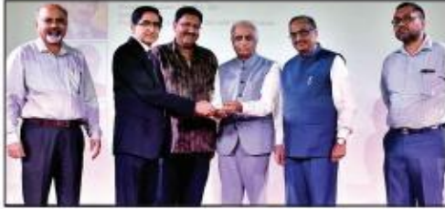
सम्मानित करते हुए।