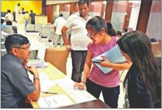
फरीदाबाद में जेसी बोस वाईएमसीए में बीटेक की पहली फिजिकल काउंसलिंग में हिस्सा लेते हुए विद्यार्थी।