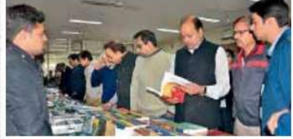
फरीदाबाद. पुस्तक मेला का अवलोकन करते छात्र एवं टीचर।

वाईएमसीए विवि में दो दिवसीय पुस्तक प्रदर्शनी शुरू