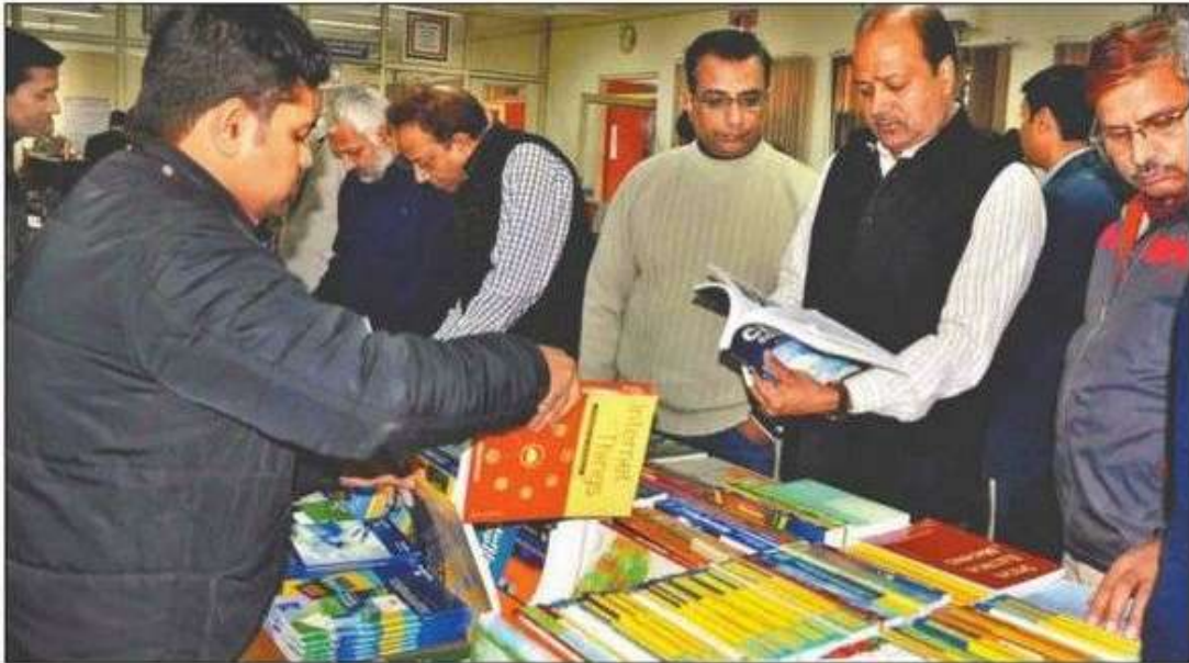
वाईएमसीए विश्वविद्यालय में बृहस्पतिवार को पुस्तक मेले का अवलोकन करते वाइस चांसलर।