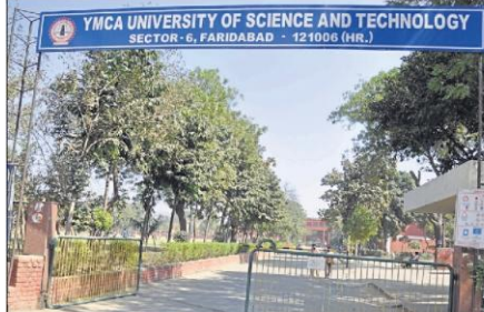
फरीदाबाद में वाईएमसीए यूनिवर्सिटी का कैम्पस।

समाचार पत्र एवं न्यूज चैनल में संपादक, संवाददाता, एंकर, प्रोड्यूसर, स्क्रीन राइटर, कंटेंट राइटर, साउंड रिकॉर्डर व साउंड मिक्सर, वीडियो जोकी, रेडियो जोकी, फोटोग्राफर, इवेंट मैनेजमेंट के रूप में रोजगार के बेहतर अवसर हैं। जबकि एमएससी रसायन विज्ञान और पर्यावरण विज्ञान यूनिवर्सिटी की जरूरत के रूप में शुरू किए गए हैं।