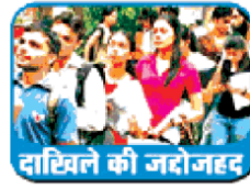
दाखिले की जदोजहद

जागरण संवाददाता, बल्लभगढ़ : कॉलेजों में दाखिला प्रक्रिया में तेजी आने लगी है। अग्रवाल कॉलेज के तीनों संकाय में अब तक विभिन्न कोर्सों के लिए 700 फार्म भरे जा चुके हैं।