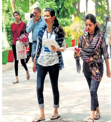
फरीदाबाद, के एन मेहता यूएमन कालेज में फार्म लेने जाते छात्राएं।

आवेदन प्रपत्र यूनिवर्सिटी की वेबसाइट से डाउनलोड किए जा सकते हैं। पूरी तरह से भरे हुए आवेदन