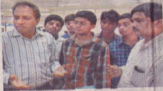
वाईएमसीए यूनिवर्सिटी में आयोजित सेमिनार में अतिथियों ने छात्रों को परमाणु विज्ञान की जानकारी दी।

परमाणु विज्ञान की नई तकनीक से लोगों को गंदे पानी से राहत दिलाई जाएगी