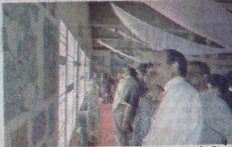
पोस्टर प्रदर्शनों का अवलोकन करते हुए कुलपति ले. जनरल (सेवानिवृत्त)