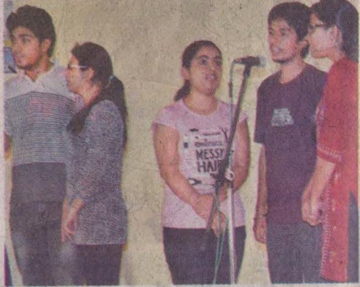
स्थापना दिवस पर रंगारंग कार्यक्रम प्रस्तुत करते छात्र-छात्राएं।