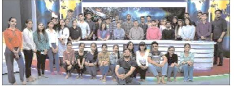
जेसी बोस विश्वविद्यालय में मीडिया के विद्यार्थियों के लिए रोजगार एवं प्रेस्क सत्र समापन पर विद्यार्थी और प्रवक्ता।

उन्होंने कहा कि छात्रों का उद्देश्य केवल डिग्री हासिल करना नहीं होना चाहिए। विद्यार्थियों को उनके कौशल विकास जैसे सॉफ्ट स्किल, संचार कौशल, व्यक्तित्व आदि को पोषित करने पर ध्यान केंद्रित करना चाहिए। उन्होंने कहा कि छात्रों को केवल सपने देखने के बजाय लीक से हटकर सोचना चाहिए। बड़े लक्ष्य निर्धारित करने चाहिए। उन्होंने यह भी कहा कि हमेशा रचनात्मक और सकारात्मक सोच के साथ आगे बढ़ना चाहिए। नकारात्मक विचार