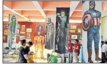
फेस्ट में छात्रों ने रोबोट एरिया को बंद चुनसुली के साथ सजाया।