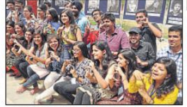
सृजन कला के सदस्यों ने यूनिवर्सिटी को कई दिन की मेहनत से सजाया-सजाया।