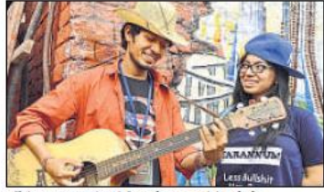
वार्षिकोत्सव कलमायका फेस्ट में गिटार की धुन पर छात्रों ने मस्ती की।