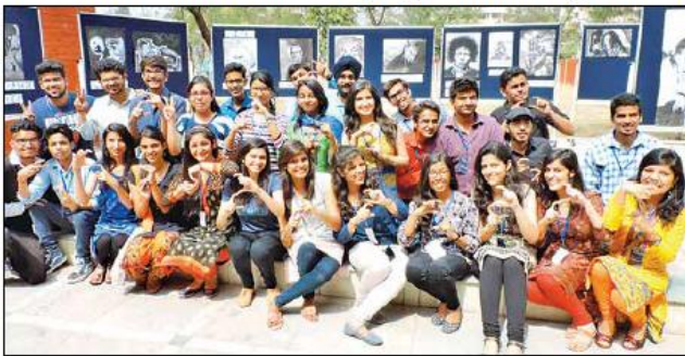
अंतरंग कला प्रदर्शनी स्थल पर मौजूद सृजन कला के सदस्य।