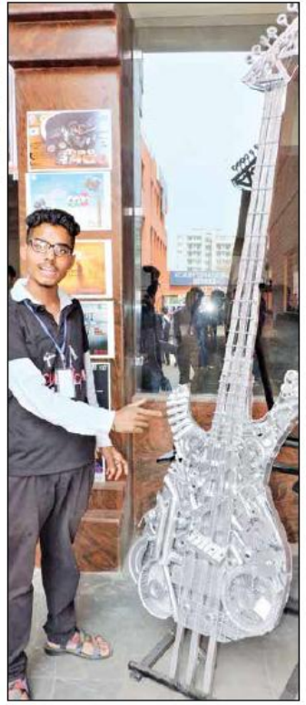
लोहे के स्टीप से तैयार किया गया मिटर।

वी थिनिंग्स : बच्चों के चलेते एनिमेटेड किरदार मिनिंग्स की प्रतिरूपित भी उत्सव में आकर्षण का केंद्र है। इसे भी सृजन कला के सदस्यों ने तैयार किया है।