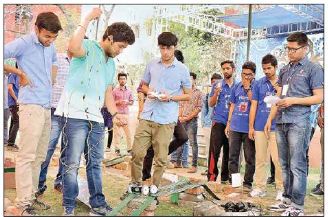
वाईएमसीए यूनिवर्सिटी में कलमायका उत्सव के दौरान रोबोटिक कार रेस में भाग लेते प्रतिभागी।