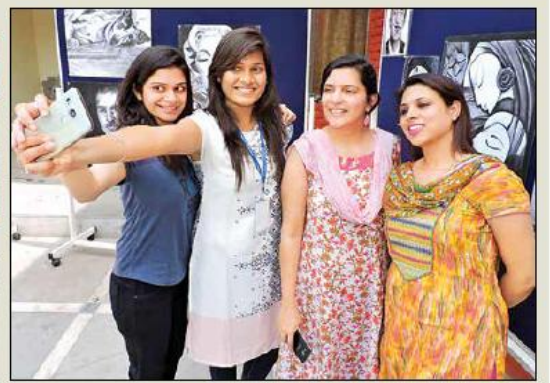
उत्सव के दौरान दिखा सैल्फी ख कैमरे।