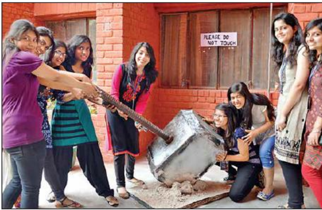
हॉलीवुड की मशहूर फिल्म थोर के किरदार से हथौड़ा।