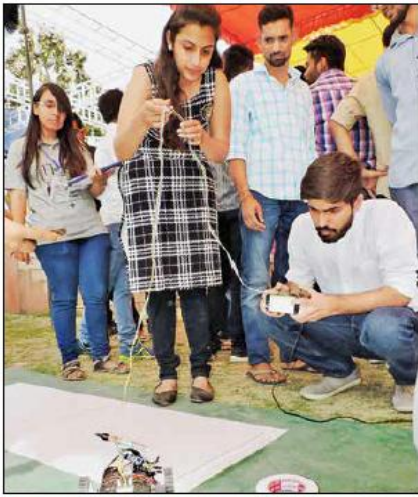
वाईएमसीए यूनिवर्सिटी में रोबोटिक कार रेस में भाग लेते प्रतिभागी।