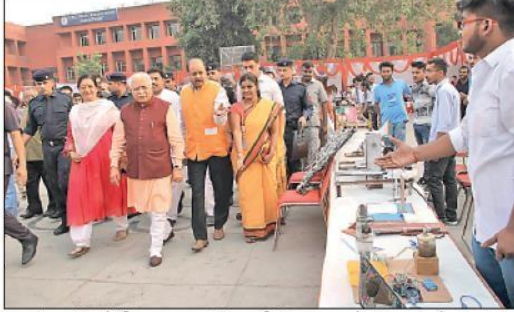
वाईएमसीए में विज्ञान प्रदर्शनी का निरीक्षण करते सीएम मनोहर लाल

मंच पर सीएम का स्वागत करते हुए यूनिवर्सिटी के कुलपति ने कहा कि पहली बार यूनिवर्सिटी आगमन पर हार्दिक आभार। इस पर सीएम ने कहा वह पहली बार नहीं आए हैं, इसके पहले वह 30-32 बार आ चुके हैं। 1980-81 के दौरान उनका यहाँ कई बार आना होता था और वे यहाँ नैतिक शिक्षा की क्लास लगाने आते थे। कई मौकों पर उन्हें संस्थान में प्रवेश करने में परेशानी का सामना भी करना पड़ता था, लेकिन 1996 में सरकार ने इसे अपने आधीन ले लिया, तो उनको ऐसी किसी दिक्कत का सामना करना नहीं पड़ा।