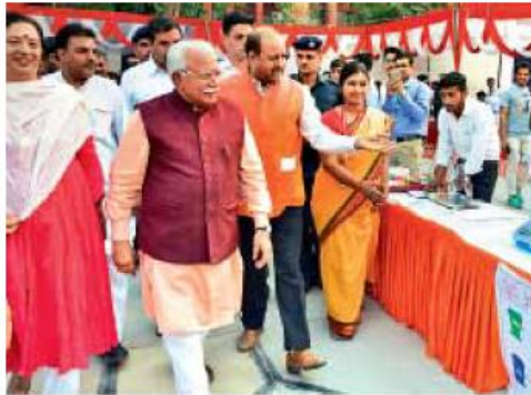
फरीदाबाद, वाईएमसीए कॉलेज में विज्ञान प्रदर्शनी का अवलोकन करते हुए सीएम।