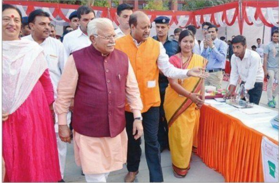
यूनिवर्सिटी में लगे विज्ञान मेले का अवलोकन करते हरियाणा के मुख्यमंत्री मनोहर लाल खट्टर।