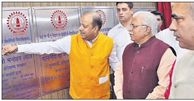
वाईएमसीए विधि में दो दिवसीय स्वर्ण जयंती विज्ञान सम्मेलन के समापन पर सीएम मनोहर लाल ने शिरकत की।