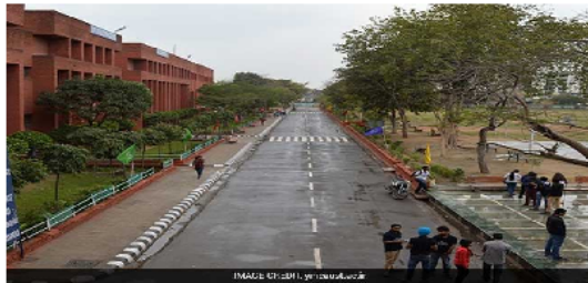
Haryanas YMCA University To Be Named After Scientist Jagadish Chandra Bose

Haryana Chief Minister Manohar Lal Khattar today announced to name YMCA University of Science and Technology, Faridabad after renowned scientist Jagadish Chandra Bose.