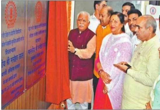
परियोजना का उद्घाटन करते मुख्यमंत्री मनोहर लाल।

सीएम ने कहा कि विश्वविद्यालय के नाम को लेकर अन्य औपचारिकताओं को जल्द पूरा कर लिया जाएगा। राज्य सरकार तकनीकी, प्रौद्योगिकी एवं मेडिकल शिक्षण संस्थान में सुविधाओं पर विशेष ध्यान दे रही है। आने वाले दिनों में स्कूलों में विज्ञान शिक्षा पर जोर दिया जाएगा। विज्ञान शिक्षकों की भर्ती की जाएगी। उन्होंने कहा कि शिक्षित एवं कुशल युवाओं से ही प्रदेश का विकास सुनिश्चित होगा। सीएम के समक्ष नये शैक्षणिक एवं गैर-शैक्षणिक पद सृजित करने, नये पाठ्यक्रम शुरू करने की मांगों को सामने रखा गया। जिस पर बजटिय प्रबंधन करने के आग्रह पर मुख्यमंत्री ने सहानुभूतिपूर्वक विचार करने की