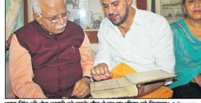
भगत सिंह की जेल डायरी को उनके पीठ ने घर पर सीएम को दिखाया।